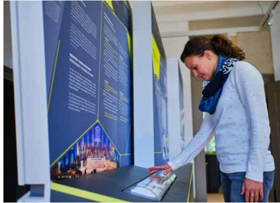
Welterbezentrum Walkenried

Das Welterbe-Infozentrum in Walkenried bietet einen Überblick über das UNESCO-Welterbe im Harz und dessen 3.000-jährige Kulturgeschichte. Zugleich ist mit dem barrierearmen Infozentrum erstmals ein Ort entstanden, der den außergewöhnlichen universellen Wert der Welterbestätte „Bergwerk Rammelsberg, Altstadt von Goslar und Oberharzener Wasserversorgung“ vermittelt. Mehr noch: Die Ausstellung verdeutlicht auch die Bedeutung von UNESCO-Welterbestätten für die gesamte Weltgemeinschaft. Denn das Welterbe gehört allen Menschen und verbindet sie grenzüberschreitend miteinander.