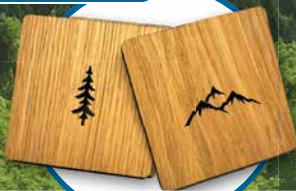
Holzbrettchen mit Harzmotiven