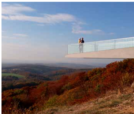
„Skywalk“ Bad Sachsa

Die HarzCard ist bei den Tourist-Informationen in Bad Sachsa und Walkenried erhältlich. Weitere Informationen auf www.harzcard.info .